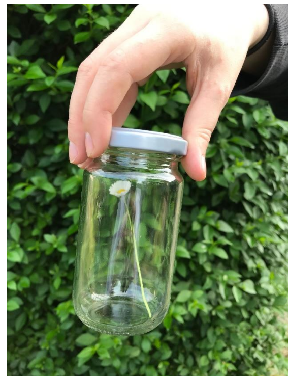
4. Und verschließe ihn in deinem Gefäß. Fertig!