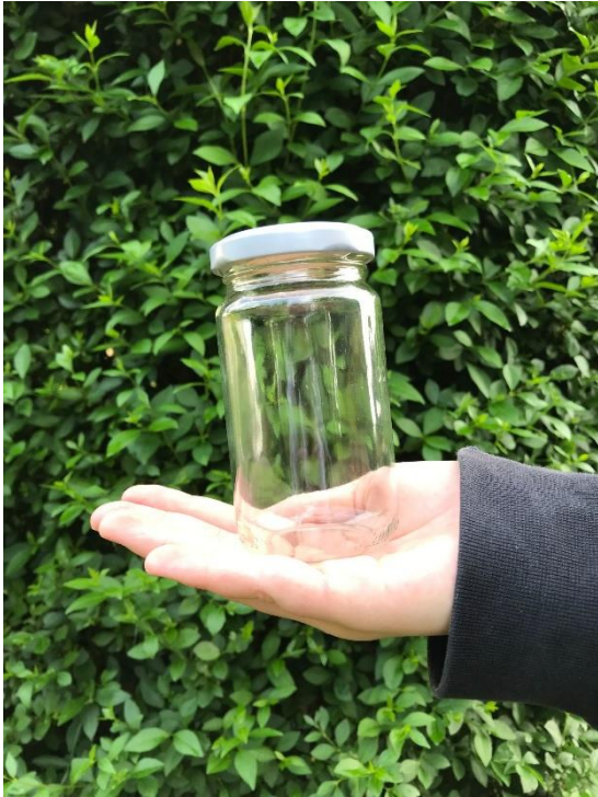
1. Suche dir ein passendes Gefäß.