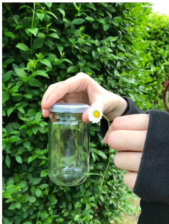
3. Bereite deinen Geruch vor.